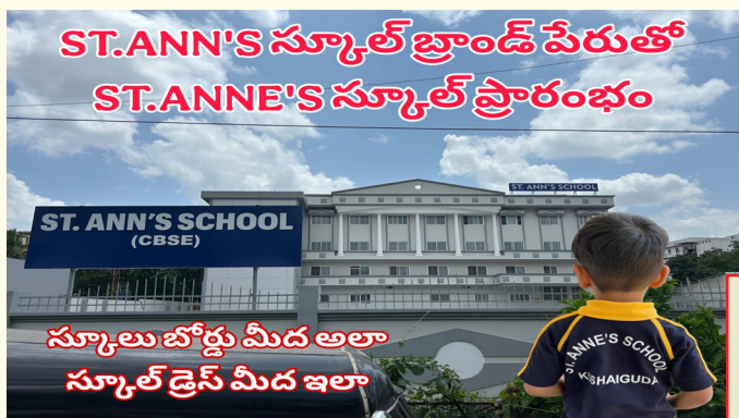
ST. ANN'S స్కూల్ బ్రాండ్ పేరుతో ST. ANNE'S స్కూల్ ప్రారంభం