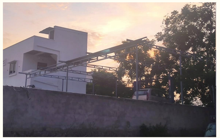
చేసుకొని అక్రమ నిర్మాణదారులపై కఠిన చర్యలు తీసుకోవాలని స్థానికులు కోరుతున్నారు.