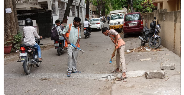
ఏఎస్ రావనగర్, జూన్ 20, (తెలంగాణ దిన) :కాప్రా నర్సల్ ఏఎస్ రావు నగర్ డివిజన్ నార్ కమలానగర్ లో ఇన్ఫ్రాసాక్షిగా వేసిన స్పీడ్ బ్రేకర్లను జి.పి.ఎం.సి సిబ్బంది తొలగించి వేశారు. నార్ కమలానగర్ లోని బి.కె.ఎల్. బయో టెక్స్టైల్ బ్రేకర్ల వేయడం విమర్శలకు తావిచ్చింది. స్పీడ్ బ్రేకర్ల కారణంగా పాదచారులు వాహన చోదకులు