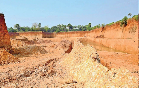
అమరావతి, తెలంగాణ దిన: వైకాపా పాలనలో మట్టి మూఫియా రెచ్చిపోయింది. అధికారమే అందగా అడ్డగోలు తవ్వకాలు చేసి అక్రమార్కులు పాల్పడ్డారు. పర్యావరణానికి తూట్లు పొడిచి సొంత జేబులు నింపుతున్నారు. స్థానికులు ఆందోళన చేసినా.. అధికారులు అడ్డుకున్నా అక్రమ తవ్వకాలు మాత్రం ఆగలేదు. 2019లో వైకాపా అధికారంలోకి రావడంతోనే చేట్లో మండలంలో అక్రమ తవ్వకాలు మొదలయ్యాయి. నాణ్యమైన గ్రావెల్ లభిస్తుండడంతో ఉమ్మడి గుంటూరు జిల్లాలో పలు ప్రాంతాలకు ఇక్కడి నుంచి మట్టి తరలించారు. నియోజకవర్గ నేత అండదండలతో ఇష్టానుజ్ఞా తవ్వకాలు చేశారు. గోరంత అనుమతులు తీసుకుని కొండంత తవ్వకాలు చేశారు. రూ.కోట్ల జరిమానాలు వేస్తున్నా వెరవక అక్రమ

తవ్వకాలు సాగించారంటే అక్రమార్కులు ఏస్థాయిలో ఆర్జన చేశారో వారికే తెలియాలి. ఇక్కడి నుంచి గ్రావెల్ తరలించి రూ.వందల కోట్లు సొమ్ము చేసుకున్నారు. ఈ విధాని జనపరిలో అప్పటి మాజీ ఎమ్మెల్యే ధూళిపాళ్ల నరేంద్రకూమర్ మట్టి తవ్వకాలపై ఫిర్యాదు చేయడంతో వైకాపా ప్రభుత్వంలోనే అధికారుల బృందం తనిఖీలు చేసి నివేదిక ఇచ్చింది. వీరనాయ కునిపాలెం, శేకూరు గ్రామాల పరిధిలో 2020 నుంచి 2022 డిసెంబరు వరకు మూడేళ్ల వ్యవధిలో జరిగిన తవ్వకాలను పరిశీలించే లక్ష్య క్యూబిక్ మీటర్ల మట్టి అక్రమంగా తవ్వితరలింపినట్లు అధికారుల బృందం గుర్తించింది. రెండు గ్రామాల్లోనే ఈస్థాయిలో అక్రమ తవ్వకాలు జరిగితే వడ్డమూడి, శలపాడు, సుద్దపల్లి తదితర ప్రాంతాల్లో ఎంతస్థాయిలో అక్రమాల జరిగాయో నిగ్గు తేల్చాలి ఉంది. రాష్ట్రంలో కూలమి ప్రభుత్వం అధికారులలోకి వచ్చిన నేపథ్యంలో చేట్లో పలు మండలంలో గత అయిదేళ్లలో జరిగిన మట్టి తవ్వకాలపై సమగ్ర విచారణ చేస్తే అక్రమాల వెలుగులోకి వచ్చే అవకాశం ఉంది. వీరనాయకునిపాలెం, శేకూరు గ్రామాల్లో భూగర్భ గనుల శాఖ నుంచి అనుమతి తీసుకుని నలుగురు తవ్వకాలు చేశారు. వీరంతా శేకూరులోనే అనుమతులు తీసుకున్నారు. 2020 నుంచి 2022 డిసెంబరు వరకు 22 మందికి తాత్కాలిక ప్రాతిపదికన అను మతులు ఇచ్చారు. తాత్కాలిక అనుమతుల ద్వారా 1,81,521 క్యూబిక్ మీటర్ల గ్రావెల్ తవ్వారు. ఇందుకు రూ. 90,26,440 చూసాలు చేశారు. 2019 నుంచి 2022 మధ్య అక్రమంగా గ్రావెల్ తవ్వితరలింపే వారి నుంచి రూ. 1.10 కోట్ల జరిమానా భూగర్భ గనుల శాఖ చూసాలు చేసింది.