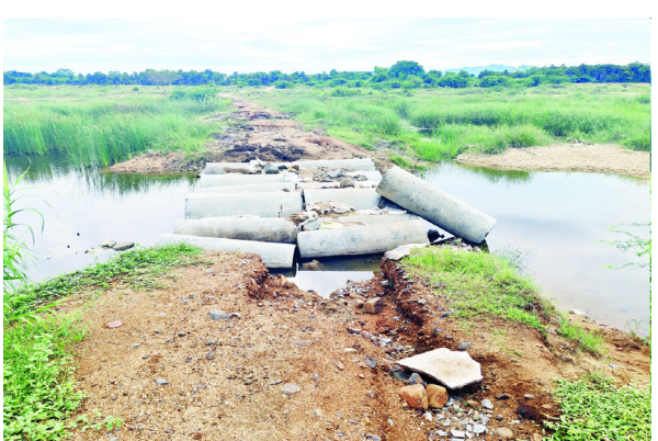
కుశ్యుల నదికి వెళ్లాలంటే దారి లేదు.. విజయపురం మండలంలోని కేవల శ్రీరామపురం కుశ్యుల నదిలో వెళ్లడానికి దారి లేదు. ఇటీవల ఇసుక తరలింపకుండా అధికారులు దారిని మూసి వేశారు. అంతే కాకుండా ఇటీవల వరదల రైతు తన ట్రాక్టర్ ను నదిలోకి తీసుకెళ్లి ఇసుక తీసుకొని వచ్చి మండలంలో రూ. 5వేలు విక్రయించుకొని సొమ్ము చేసుకొంటున్నారు. ఎందుకంటే తన ట్రాక్టర్ తప్ప, మిగిలిన వారు ఎవ్వరూ ఆ దారిలో వెళ్లకూడదని ఆ రైతు హెచ్చరిస్తున్నాడు. వెళితే ఓట్రాక్టరుకు రూ. 500 చూసాలు చేస్తున్నాడు. దీంతో ఇసుకకు డిమాండ్ ఎక్కువైంది. ఇప్పటికైనా అధికారులు కుశ్యుల నదిలో దారి ఏర్పాటు చేస్తే ఇసుక ఉచితంగా లభిస్తుందని వెంటనే దారి ఏర్పాటు చేయాలని ట్రాక్టర్ యజమానులు కోరుతున్నారు.

శ్రీ కుశ్యులలో ఇసుక వున్నా దారి లేదు.. శ్రీ ఓ రైతు పొలంపై వెళ్లాలంటే శ్రీవుక్తు రూ. 500 చెల్లించాలి శ్రీ టి.డి.పి నాయకులకు ఒత్పాను పలుకుతున్న అధికారులు ప్రజాశక్తి -విజయపురం: రాష్ట్ర ప్రభుత్వం ఇసుక ఉచితం అని చెప్పినా విజయపురం మండలంలో అది ఎక్కడా అమలు కావడం లేదు. కేవల శ్రీరామపురం వద్ద కుశ్యుల నదిలో ఇసుక వుంది. కానీ ట్రాక్టర్ వెళ్లడానికి దారి లేదు. దీంతో ఇసుక దొరకడం కష్టంగా మారింది. దీన్ని అదునుగా తీసుకొని కొందరు ట్రాక్టర్ యజమానులు ట్రాక్టర్ ఇసుకను రూ. 5 వేలుకు అమ్ముకొంటున్నారు. అయితే ఈ విషయం అధికారుల దృష్టికి తీసుకెళ్లాలి.. రూ. 5వేలుకు ఇసుక అమ్ముతున్న వారి వద్ద ఇసుక కొనుగోలు చేయవద్దని ఉచిత సలహా ఇస్తున్నారే తప్ప 70% ఎక్కువ ధరకు ఇసుక అమ్ముతున్న ట్రాక్టర్ యజమాన్యంపై ఎలాంటి చర్యలు తీసుకోకపోవడంపై స్థానిక ప్రజలు అసహనాలు వ్యక్తం చేస్తున్నారు. కుశ్యుల నదికి వెళ్లాలంటే దారి లేదు.. విజయపురం మండలంలోని కేవల శ్రీరామపురం కుశ్యుల నదిలో వెళ్లడానికి దారి లేదు. ఇటీవల ఇసుక తరలింపకుండా అధికారులు దారిని మూసి వేశారు. అంతే కాకుండా ఇటీవల వరదల రైతు తన ట్రాక్టర్ ను నదిలోకి తీసుకెళ్లి ఇసుక తీసుకొని వచ్చి మండలంలో రూ. 5వేలు విక్రయించుకొని సొమ్ము చేసుకొంటున్నారు. ఎందుకంటే తన ట్రాక్టర్ తప్ప, మిగిలిన వారు ఎవ్వరూ ఆ దారిలో వెళ్లకూడదని ఆ రైతు హెచ్చరిస్తున్నాడు. వెళితే ఓట్రాక్టరుకు రూ. 500 చూసాలు చేస్తున్నాడు. దీంతో ఇసుకకు డిమాండ్ ఎక్కువైంది. ఇప్పటికైనా అధికారులు కుశ్యుల నదిలో దారి ఏర్పాటు చేస్తే ఇసుక ఉచితంగా లభిస్తుందని వెంటనే దారి ఏర్పాటు చేయాలని ట్రాక్టర్ యజమానులు కోరుతున్నారు.