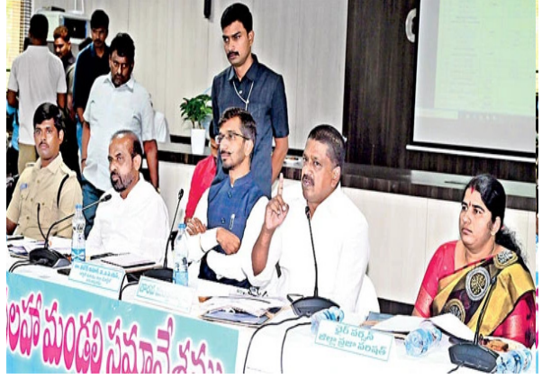
చీరాల, తెలంగాణ దిన: కేంద్ర, రాష్ట్ర ప్రభుత్వాల అమలు చేసే అభివృద్ధి, సంక్షేమ పథకాలకు ఆధారం కాల్చే ఎంతో కీలకమైంది. ఆధార సమీక్షలకు ఉమ్మడి గుంటూరు జిల్లాలో లక్షల మంది ఇంకా దూరంగా ఉన్నారు. మంగళవారం నుంచి వరకు జిల్లాలో ఆధార ప్రత్యేక శిబిరాలు నిర్వహించేందుకు అధికారులు ఏర్పాట్లు పూర్తి చేశారు. మండలాల్లో