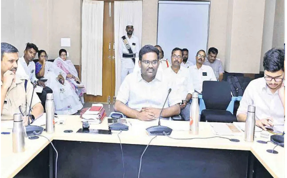
కంఠేశ్వర్, తెలంగాణ దిశ: జిల్లాలో మాదక ద్రవ్యాల నియంత్రణకు సంబంధిత శాఖల అధికారులు పకడ్బందీ చర్యలు తీసుకోవాలని