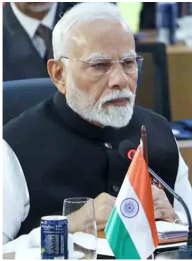
బైజల్, జూలై 07: జమ్మ కర్షీర్లోని పహలాంగలో పర్యాటకులపై జరిగిన ఉగ్రదాడిని ప్రధాన మంత్రి నరేంద్ర మోదీ

మరోసారి తీవ్రంగా ఖండించారు. ఈ మేరకు పాఠశాలలో పాకిస్థాన్ పై తీవ్ర స్థాయిలో విమర్శలు గుప్పించారు. బైజల్లో జరిగిన బ్రిక్స్ శిఖరాగ్ర సమావేశంలో ప్రధాని మోదీ పాల్గొని ప్రసంగించారు. పాక్ ఉగ్రవాద మద్దతుదారుని, భారత్ ఉగ్రవాద బాధిత దేశమని ఈ సందర్భంగా పేర్కొన్నారు. ఈ రెండింటినీ ఒకే త్రాసులో తూకం వేయలేమన్నారు. 'పాకిస్థాన్ ఉగ్రవాదులకు మద్దతుగా నిలుస్తోంది. భారత్ మాత్రం ఉగ్రవాద బాధితులను కాపాడుతుంది. ఈ రెండింటినీ ఒకే త్రాసులో తూకం వేయలేం' అని ప్రధాని పేర్కొన్నారు. ఉగ్రవాదులకు మౌనంగా మద్దతు ఇవ్వడం కూడా ఆమోదయోగ్యం కాదని వ్యాఖ్యానించారు. ఈ సందర్భంగా పహలాంగ ఉగ్రదాడిని ఖండించడంలో భారతదేశానికి మద్దతుగా నిలిచిన దేశాలకు ప్రధాని కృతజ్ఞతలు తెలిపారు. బైజల్లోని రెయో డి జెనీర్లో బ్రిక్స్ శిఖరాగ్ర సదస్సు జరుగుతోంది.