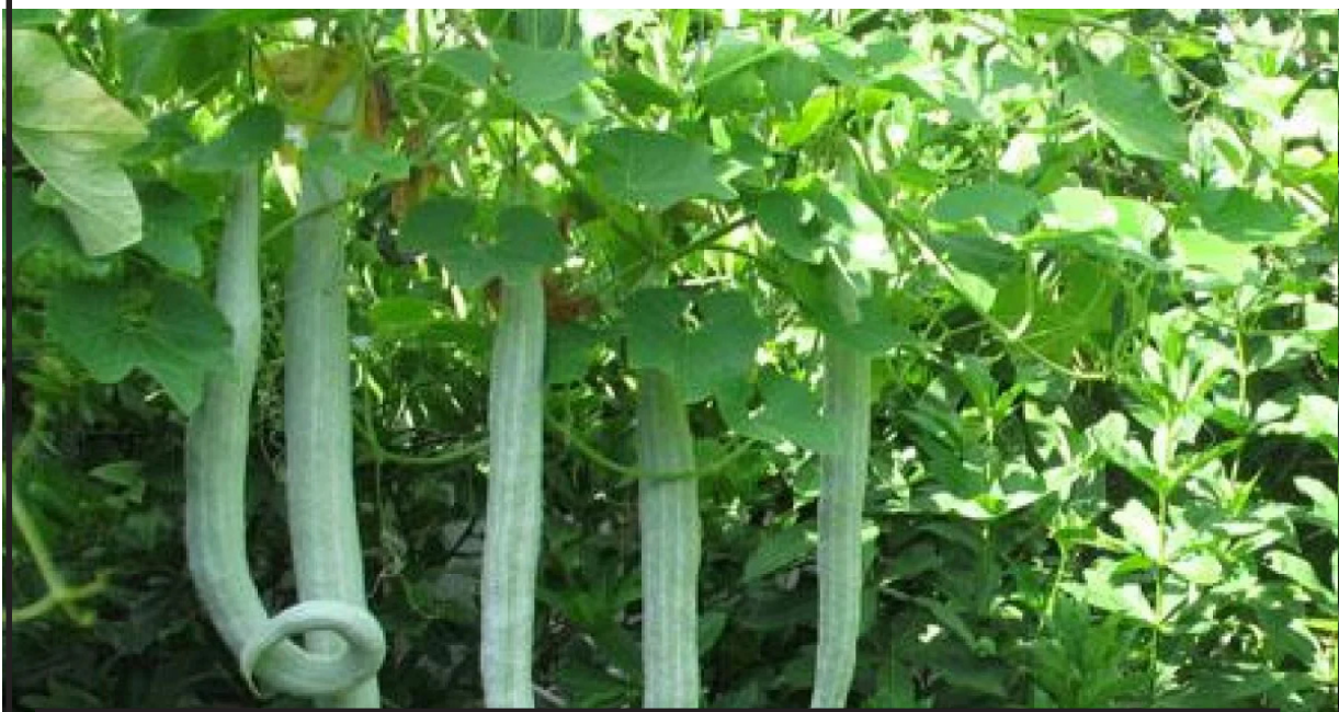
పొట్లకాయలు అంటే ఇష్టం లేదని దూరం పెడుతున్నారా..