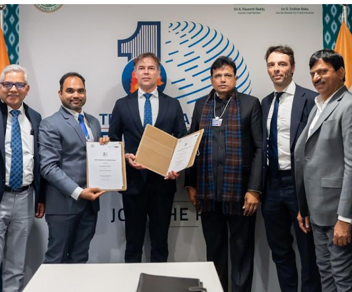
భారత్ ప్యూబర్ సిటీలో 100 మెగావాట్ల