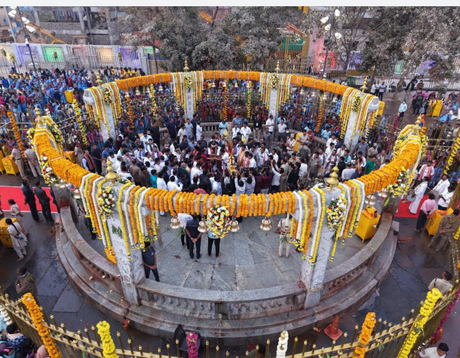
మేడారం గిరిజన జాతరకు

భోపాల్, : మధ్యప్రదేశ్ లోని వివాదాస్పద భోజ్ శాల అలయం-కమల్ మాలా మసీదు కాంప్లెక్స్ వద్ద ప్రార్థనల విషయంలో సుప్రీంకోర్టు గురువారం కీలక ఉత్తర్వులు జారీచేసింది. ఈ ప్రాంతంలో శుక్రవారం హిందూ, ముస్లింలు ప్రార్థనలు చేసుకునేందుకు అనుమతించింది. వసంత పంచమి సందర్భంగా సూర్యోదయం నుంచి సూర్యాస్తమయం వరకూ హిందూ మతస్థులు ప్రార్థనలు చేసుకునేందుకు అనుమతించింది. మధ్యాహ్నం 1 గంట నుంచి 3 గంటల వరకూ ముస్లింలు శుక్రవారం ప్రార్థనలు చేసుకోవచ్చని అత్యున్నత న్యాయస్థానం తన ఆదేశాల్లో పేర్కొంది.