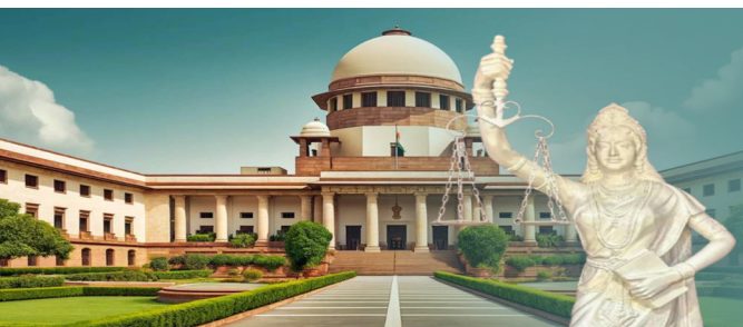
భోజ్ శాలపై సుప్రీం కీలక

దావోస్: అమెరికా అధ్యక్షుడు డొనాల్డ్ ట్రంప్ సంవలన ప్రకటన చేశారు. గ్రీన్ లాండ్, మొత్తం అర్బిటిక్ ప్రాంత భద్రత విషయంలో నాటోతో ఒక కీలక ఒప్పందానికి ప్రీమ్ వర్క్ కు దిగివచ్చి ఆయన వెల్లడించారు. స్విట్జర్లాండ్ లోని దావోస్ లో జరుగుతున్న ప్రపంచ ఆర్థిక వేదిక సదస్సులో ఈ విషయాన్ని ప్రకటించారు.