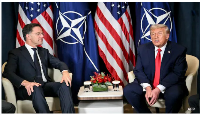
గ్రీన్ లాండ్ పై నాటోతో

పేజీలు : 8 వెల : రూ.4/- PAGES : 8 RS : 4/-