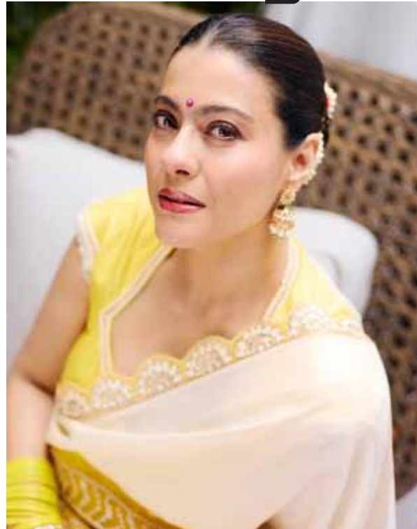
అధికారిక ప్రకటన వెలువడాల్సి ఉంది.

ప్రభాస్ హీరోగా, దర్శకుడు సందీప్ రెడ్డి వంగా తెరకెక్కిస్తున్న హై-వోల్టేజ్ యాక్షన్ డ్రామా 'స్పిరిట్'. ఈ చిత్రం మోగాస్టార్ చిరంజీవి చేతుల మీదుగా ఇటీవల వూజా కార్పొరేషన్ ద్వారా చేసుకున్న విషయం తెలిసిందే. ప్రస్తుతం ఈ సినిమా షూటింగ్ జరుపుకుంటుండగా.. ఈ ప్రాజెక్ట్ గురించి ఇండస్ట్రీలో ఒక ఆసక్తికరమైన వార్త ప్రస్తుతం జోరుగా వినిపిస్తోంది. ఈ ప్రతిష్టాత్మక చిత్రంలో బాలీవుడ్ సీనియర్ స్టార్ హీరోయిన్ కాజోల్ దేవగన్ కీలక పాత్ర పోషించనున్నట్లు తెలుస్తుంది. 'స్పిరిట్' చిత్రంలో మొదట హీరోయిన్ పాత్ర కోసం బాలీవుడ్ నటి కరీనా కపూర్ పేరు వినిపించినప్పటికీ, ఆమె ఆ రూమరలను ఖండించారు. ఇప్పటికే ఈ చిత్రంలో హీరోయిన్ గా త్రిప్తి దివ్రా ఎంపికయ్యారు. తాజాగా అందిన సమాచారం ప్రకారం, 'స్పిరిట్'లో ఒక శక్తివంతమైన పాత్ర కోసం దర్శకుడు సందీప్ రెడ్డి వంగా బాలీవుడ్ నటి కాజోల్ ను సంప్రదించినట్లు తెలుస్తోంది. కాజోల్ కి కూడా స్క్రిప్ట్ బాగా నచ్చిందని ఆమె ఈ ప్రాజెక్ట్ లో భాగమవడానికి పాజిటివ్ గా స్పందించినట్లు ఇండస్ట్రీ వర్గాలు చెబుతున్నాయి. ఈ వార్త నిజమైతే, 'స్పిరిట్' కాజోల్ కు మొదటి తెలుగు సినిమా కానుంది. ఆమె ఇంతకుముందు కొన్ని తమిళ చిత్రాలలో నటించినప్పటికీ, తెలుగులో ఇప్పటివరకు నటించలేదు. కాజోల్ లాంటి నటి 'స్పిరిట్' లో నటించే విశేషాలు అభిప్రాయపడుతున్నారు. ప్రస్తుతం ఈ వార్తపై