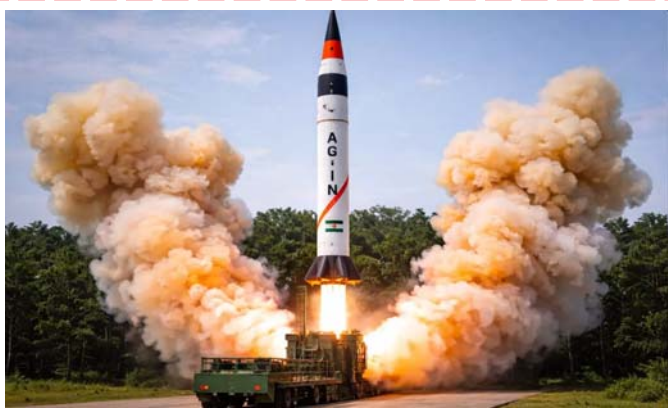
శత్రు దేశాలకు వణుకు పుట్టిస్తున్న..

పేజీలు : 8 వెల : రూ.4/- PAGES : 8 RS : 4/-