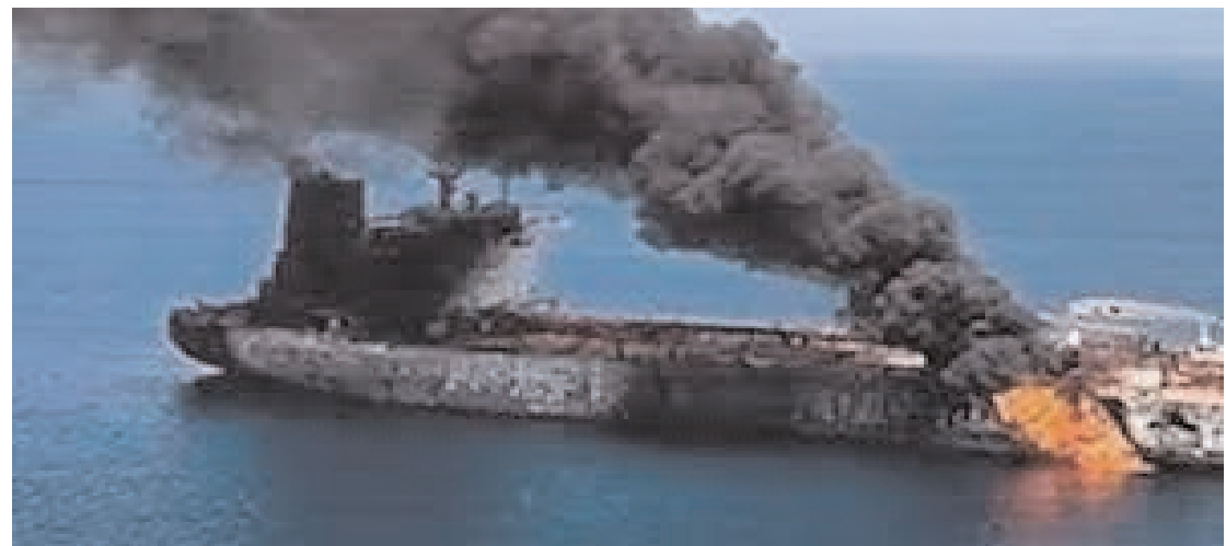
దేనాపై జరిగిన దాడికి అమెరికా కచ్చితంగా మూల్యం చెల్లించుకుంటుందని ఇరాన్ విదేశాంగ మంత్రి హెచ్చరించిన నేపథ్యంలో ఈ దాడి జరిగింది. అమెరికా, ఇజ్రాయెల్-ఇరాన్ మధ్య తీవ్రస్థాయిలో యుద్ధం కొనసాగుతోంది. ఈ నేపథ్యంలో హోర్నుజ్ జలసంధిని మూసివేస్తున్నామని, ఇక్కడి నుంచి ప్రయాణించే నౌకలను పేల్చివేస్తామని ఇరాన్ ప్రకటించింది. అనంతరం శ్రీలంక సమీపంలో ఇరాన్ యుద్ధ నౌక ఐరిస్ దేనాపై అమెరికా దాడి చేసి, ముంచివేసింది. దీనితో గల్ఫ్లోని అమెరికా ట్యాంకర్పై దాడి చేసింది. తీర్చుకుందని మీడియా కథనాలు వెల్లడిస్తున్నాయి. శ్రీలంక దక్షిణ తీరంలో తమ యుద్ధనౌకను ముంచిన ఇర్రవై నాలుగు గంటల్లోనే ఇరాన్ అమెరికా ట్యాంకర్పై దాడి చేసింది.

శ్రీలంక దక్షిణ తీరంలో ఇరాన్ యుద్ధనౌకను ముంచిన అమెరికా గల్ఫ్లోని అమెరికా ట్యాంకర్పై దాడి చేసిన ఇరాన్ 24 గంటల్లో అమెరికాపై ప్రతీకారం తీర్చుకున్న ఇరాన్ హిందూ మహాసముద్రంలో ఇరానియన్ యుద్ధనౌక ఐరిస్ దేనాపై దాడి జరిగిన కొన్ని గంటల తర్వాత, ఇస్లామిక్ రివల్యూషనరీ గార్డ్స్ కార్పొర్షన్ (ఐఆర్డీసీ) ఉత్తర పర్షియన్ గల్ఫ్లో ఒక అమెరికన్ ట్యాంకర్ను ఢీకొట్టినట్లు ప్రకటించింది. ఈ మేరకు రాంటర్బర్గ్ పేర్కొంది. అమెరికా నౌక మంటల్లో చిక్కుకుందని ఇరాన్ మీడియా తెలిపింది. శ్రీలంక తీరంలో ఐరిస్