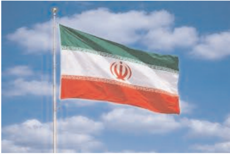
హెచ్చరించింది. పశ్చిమాసియాలో అమెరికా, ఇజ్రాయెల్-ఇరాన్ మధ్య గత ఆరు రోజులుగా భీకర యుద్ధం సాగుతోంది. ఇరాన్ సుప్రీం లీడర్ ఖమేనీ ఇజ్రాయెల్, అమెరికా సంయుక్త దాడిలో మృతి చెందారు. ఖమేనీ మృతి చెందిన తర్వాత యుద్ధం మరింత ఉద్బుతంగా మారింది. ఇజ్రాయెల్, అమెరికా తమ లక్ష్యాలను చేరుకున్నాయని, ఈ నేపథ్యంలో ట్రంప్ ఎప్పుడైనా యుద్ధాన్ని ఆపివేయవచ్చని వార్తలు వచ్చాయి. దీనిపై స్పందించిన ఇజ్రాయెల్ అధికారి ఇరాన్లో పాలకులు మారే వరకు యుద్ధం కొనసాగుతుందని స్పష్టం చేశారు. పాలకులను మార్చుతామంటూ ఇజ్రాయెల్ చేసిన ప్రకటనపై ఇరాన్ తీవ్రంగా స్పందించింది. తమ దేశంలో పాలనను మార్చే ప్రయత్నం చేస్తే ఇజ్రాయెల్లోని అణు షాంటన్సు లక్ష్యంగా చేసుకుంటామని ఇరాన్ హెచ్చరికలు జారీ చేసింది. అంతేకాకుండా పశ్చిమాసియాలో చమురు మౌలిక సదుపాయాలను తమ క్షిపణులు లక్ష్యంగా చేసుకుంటామని పేర్కొంది.

ఆరు రోజులుగా ఇజ్రాయెల్, అమెరికా-ఇరాన్ మధ్య భీకర యుద్ధం ఇరాన్లో పాలకులు మారే వరకు యుద్ధం కొనసాగుతుందన్న ఇజ్రాయెల్ పాలనను మార్చాలని చూస్తే అణు షాంటన్సు లక్ష్యంగా చేసుకుంటామని ఇరాన్ అమెరికాను హెచ్చరిక