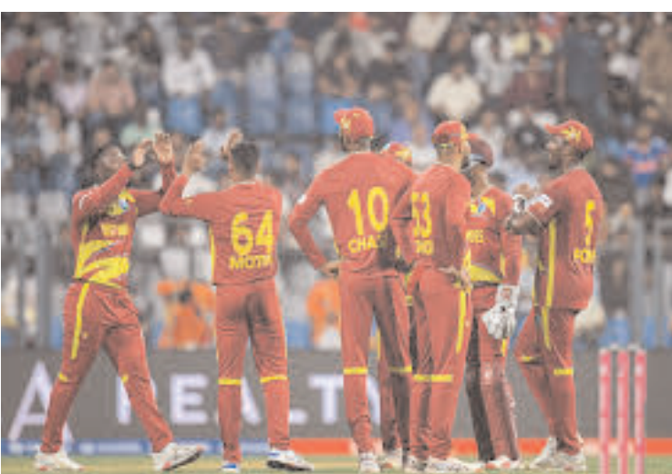
చిక్కుకుపోయామన్న విండీస్ కోచ్

భారత్ లో చిక్కుకుపోయిన విదేశీ క్రికెట్ జట్ల కోసం ప్రత్యేక విమానాలు మిడిల్ ఈస్ట్ గగనతల ఆంక్షలతో విమాన సర్వీసులకు అంతరాయం వినీసీ ఏర్పాటు చేసిన ప్రత్యేక చార్టర్డ్ విమానాల్లో జట్ల పయనం నేడు ముంబై నుంచి లండన్ కు బయలుదేరనున్న ఇంగ్లండ్ టీమ్ రేపు కోల్కతా నుంచి వెళ్లనున్న వెస్టిండీస్, దక్షిణాఫ్రికా జట్లు ఆరు రోజులుగా కోల్కతాలోనే