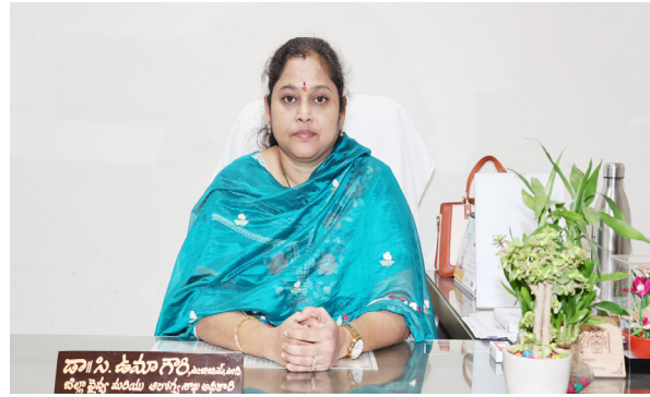
వరకు స్వీకరిస్తామని తెలిపారు. దరఖాస్తులను జిల్లా వైద్య, ఆరోగ్య అధికారి కార్యాలయం, అంతాంపల్లిలో అందజేయాలని కోరారు. అభ్యర్థులు దరఖాస్తు ఫారమ్తో పాటు విద్యార్హతలు, అనుభవానికి సంబంధించిన సర్టిఫికేట్ల జాబితా ప్రతులు రూ. 500 డిమాండ్ డ్రాఫ్టును సమర్పించాలని తెలిపారు. అర్హత గల స్థానిక అభ్యర్థులు ఈ అవకాశాన్ని వినియోగించుకోవాలని ఆమె సూచించారు.