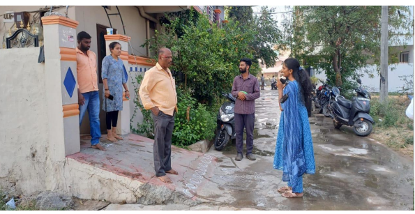
కృష్ణలక్ష్మి, మార్చి 10, (తెలంగాణ దిన) : తెలంగాణ ప్రభుత్వం చేపట్టిన 99 రోజుల ‘ప్రజా పాలన, ప్రగతి ప్రణాళిక’ కార్యక్రమంలో భాగంగా ఐదవ రోజు కొంపల్లి సర్కిల్ 56లో స్వచ్ఛత చర్యలను మరింత బలోపేతం చేసే దిశగా ప్రత్యేక కార్యక్రమాలు చేపట్టారు. ఈ కార్యక్రమంలో భాగంగా ఇంటింటి చెత్త సేకరణ సేవలు అందని

- ప్రజా పాలన, ప్రగతి ప్రణాళిక 99 రోజుల కార్యక్రమంలో భాగంగా చర్యలు