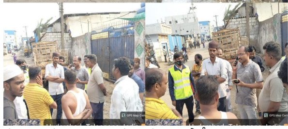
గృహాలను గుర్తించి, ఆయా గృహాలకు స్వచ్ఛ సాఫీలను అనుసంధానం చేశారు. ఎన్ఎఫ్ఐ బృందాలు ప్రాంతాలను సందర్శించి చెత్త సేకరణ సేవలు అందని గృహాలను గుర్తించి, వెంటనే సంబంధిత స్వచ్ఛ సాఫీలకు బాధ్యతలు అప్పగించారు. ఈ సందర్భంగా అధికారులు ప్రజలకు ఇంటింటి చెత్తను సరైన విధంగా అందజేయాలని, పరిసరాలను పరిశుభ్రంగా ఉంచడంలో మునిపాలిటికీ సహకరించాలని సూచించారు. పరిశుభ్రమైన పరిసరాలు ఆరోగ్యకరమైన జీవనానికి ఎంతో ముఖ్యమని తెలిపారు. ఈ కార్యక్రమాన్ని డిప్యూటీ కమిషనర్ ఎం. కృష్ణారెడ్డి పర్యవేక్షణలో మునిసిపల్ అధికారులు, సిబ్బంది కలిసి విజయవంతంగా నిర్వహించారు.