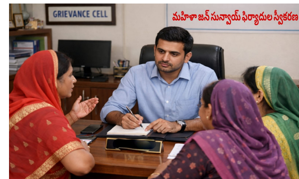
మేధుల్ జిల్లా ప్రతినధి, మార్చి 11, (తెలంగాణ దిన) : అంతర్జాతీయ మహిళా దినోత్సవం సందర్భంగా మహిళల సమస్యలను నేరుగా విని పరిష్కరించేందుకు జాతీయ మహిళా కమిషన్ ప్రత్యేక కార్యక్రమాన్ని నిర్వహిస్తున్నట్లు మేధుల్--మల్కాజిగిరి జిల్లా కలెక్టర్ మను చౌదరి తెలిపారు. అంతర్జాతీయ మహిళా దినోత్సవాన్ని పురస్కరించుకొని మార్చి 8 నుంచి 13 వరకు దేశవ్యాప్తంగా జాతీయ మహిళా కమిషన్, రాష్ట్ర మహిళా కమిషన్ ఆధ్వర్యంలో మహిళా జన్ సున్యాయ్ కార్యక్రమాలు నిర్వహిస్తున్నారు. ఇందులో భాగంగా మార్చి 12 గురువారం మల్కాజిగిరి పోలీస్ కమిషనరేట్ లో మహిళా జన్ సున్యాయ్ నిర్వహించనున్నారు. ఈ కార్యక్రమానికి జాతీయ మహిళా కమిషన్ చైర్ పర్సన్ విజయ రూత్ ప్రధాన అధ్యక్షత వహించనున్నారు. ఈ సందర్భంగా జిల్లాలోని మహిళల సమస్యలకు సంబంధించిన ఫిర్యాదులను పరిశీలించి, వాక్-ఇన్ ఫిర్యాదులను కూడా స్వీకరించనున్నారు. మహిళలు ఈ అవకాశాన్ని సద్వినియోగం చేసుకొని తమ సమస్యలను నేరుగా తెలియజేయాలని జిల్లా కలెక్టర్ మను చౌదరి ఒక ప్రకటనలో కోరారు.