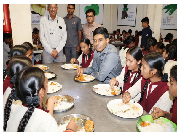
అందిస్తామని హామీ ఇచ్చారు. న్యూల్ యాజమాన్యం అవసరమైన సామగ్రి, విద్యార్థులు కోరిన ఆట వస్తువులు తదితర అంశాలపై ప్రతిపాదనలు తనకు చంపాలని సూచించారు. అనంతరం స్టోర్ రూమ్ ను పరిశీలించిన కలెక్టర్, పంట సామగ్రిపై ఎక్స్ పైరీ తేదీలను పరిశీలిస్తూ గడువు ముగియకముందే వాటిని వినియోగించాలని, నాణ్యత గల వస్తువులనే ఉపయోగించాలని సూచించారు.

సూచించారు. బుధవారం ఘట్ కేసర్ మండలంలోని తెలంగాణ సోషల్ వెల్ఫేర్ రెసిడెన్షియల్ షెల్ ఆఫ్ న్యూల్ ను కలెక్టర్ సందర్శించారు. ఈ సందర్భంగా విద్యార్థులతో కలిసి మధ్యాహ్న భోజనం చేశారు. అనంతరం ఆయన మాట్లాడుతూ, మధ్యాహ్న భోజనాన్ని ప్రతిరోజూ మేనూ ప్రకారం సమయానికి, పాష్టికాహారంతో విద్యార్థులకు అందించాలని అధికారులకు సూచించారు. వసతి గృహంలో బోధన విధానం, అందుతున్న సౌకర్యాలపై సంబంధిత అధికారులను అడిగి తెలుసుకున్నారు. న్యూల్ లోని కూబిహూడి, గిలూర్, కీబోర్డ్, పెయింటింగ్ వంటి విభాగాలను పరిశీలించి, విద్యార్థుల సంఖ్య, అందిస్తున్న సర్టిఫికేట్ కోర్సులు వివరాలను తెలుసుకున్నారు. విద్యార్థులు రూపొందించిన పెయింటింగ్ ను పరిశీలించిన ఆయన, ప్రత్యేకంగా ఒక వెబ్ సైట్ రూపొందించి అందులో ఈ పెయింటింగ్ ను ఉంచితే ఆసక్తి గల వారు ఆర్డరు ఇవ్వవచ్చని సూచించారు. అలాగే సంగీత వాద్యాలు నేర్చుకున్న విద్యార్థులు ప్రభుత్వ కార్యక్రమాలలో పాల్గొనేలా చూడాలని అధికారులకు సూచించారు. ఈ సందర్భంగా విద్యార్థులతో కలిసి భోజనం చేసిన కలెక్టర్ వారికి ఏవైనా ఇబ్బందులు ఉన్నాయా అని అడిగి తెలుసుకున్నారు. విద్యార్థులను ఆదుకునేందుకు ఫుల్ టాల్, చెస్, వాలీబాల్ వంటి ఆట సామగ్రి, అలాగే ఆర్ట్స్ కు అవసరమైన పరికరాలు అందించాలని కోరారు. దీనికి స్పందించిన కలెక్టర్ అవసరమైన వస్తువులను తప్పకుండా