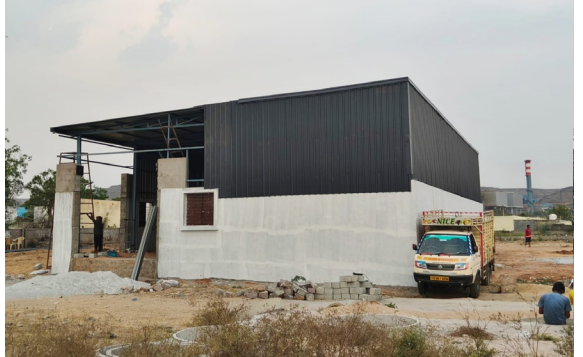
జరుగుతున్న అక్రమ వాణిజ్య షెడ్డు నిర్మాణంపై జిహెచ్ఎంసి టౌన్ ప్లానింగ్ అధికారులు తక్షణమే స్పందించి కఠిన చర్యలు తీసుకోవాలని స్థానిక ప్రజలు డిమాండ్ చేస్తున్నారు.

ముఖ్య విభాగాల్లో టౌన్ ప్లానింగ్ ఒకటైనప్పటికీ, అక్రమ నిర్మాణాల విషయంలో అధికారులు నిర్లక్ష్యంగా వ్యవహరిస్తున్నారని స్థానికులు విమర్శిస్తున్నారు. కీసర్ సర్కిల్-01 డిప్యూటీ కమిషనర్, డి.పీ.ఓ., మల్కాజిగిరి మున్సిపల్ కార్పొరేషన్ అధికారుల స్పందన లేకపోవడంతో అక్రమాలకు ప్రోత్సాహం లభిస్తున్నదనే ఆభీప్రాయం వ్యక్తమవుతుంది. ఈ నేపథ్యంలో జవహర్ నగర్లో