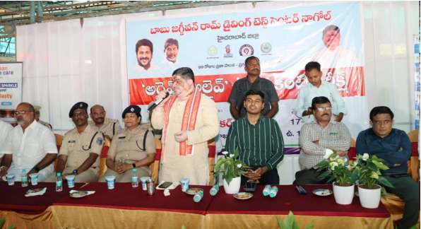
హైదరాబాద్ (నాగోల్), ఏప్రిల్ 17, (తెలంగాణ దిన) : రోడ్డు ప్రమాదాల సమయంలో గోల్డెన్ అవర్స్ బాధితులను ఆసుపత్రికి తరలించి ప్రాణాలు కాపాడిన వారికి రూ. 25 వేల పారితోషకం అందజేస్తున్నట్లు రాష్ట్ర రోడ్డు రవాణా శాఖ మంత్రి పాన్సం ప్రభాకర్ తెలిపారు. కేంద్ర, రాష్ట్ర ప్రభుత్వాల సంయుక్తంగా ఈ ప్రోత్సాహాన్ని అందిస్తున్నాయని పేర్కొన్నారు. నాగోల్ లోని ఆర్టీవో కార్యాలయంలో నిర్వహించిన ప్రజా పాలన - ప్రగతి ప్రణాళికలో భాగంగా జరిగిన "అర్డెన్ అర్డెన్" రోడ్డు భద్రత కార్యక్రమంలో మంత్రి ముఖ్య అతిథిగా పాల్గొన్నారు. ఈ సందర్భంగా మాట్లాడుతూ చిన్న చిన్న నిర్ణయాలు, పాఠాల్ని వల్లనే ఎక్కువ రోడ్డు ప్రమాదాలు జరుగుతున్నాయని, అనేక మంది ప్రాణాలు కోల్పోవడమే కాకుండా జీవితాంతం అచేతనంగా మారుతున్నారని ఆవేదన వ్యక్తం చేశారు.

రోడ్డు ప్రమాదాల వల్ల కుటుంబాలు తీవ్ర ఇబ్బందులు ఎదుర్కొంటున్నాయని, ట్రాఫిక్ నిబంధనలు పాటిస్తే చాలా వరకు ప్రమాదాలను నివారించవచ్చని మంత్రి స్పష్టం చేశారు. రోడ్డు భద్రతపై ప్రజల్లో అవగాహన పెంపొందించేందుకు ప్రభుత్వం వివిధ కార్యక్రమాలు చేపడుతోందని తెలిపారు. కార్యక్రమంలో భాగంగా ప్రజలతో ట్రాఫిక్ నిబంధనలు పాటిస్తామని ప్రతిజ్ఞ చేయించారు. ఈ సందర్భంగా మేధ్వల్, మల్కాజిగిరి జిల్లా కలెక్టర్ మను చౌదరి మాట్లాడుతూ ప్రజా పాలన--ప్రగతి ప్రణాళికలో భాగంగా 99 రోజుల కార్యచరణలో ప్రతి వారం ఒక అంశంపై అవగాహన కల్పిస్తున్నామని తెలిపారు. ఈ వారం "అర్డెన్ అర్డెన్" కార్యక్రమాన్ని పోలీస్, ట్రాన్స్పోర్ట్, రెవెన్యూ శాఖల సమన్వయంతో నిర్వహిస్తామని చెప్పారు. ప్రతి రోజూ దేశ వ్యాప్తంగా 400 నుంచి 500 వరకు రోడ్డు ప్రమాదాల్లో ప్రాణాలు కోల్పోతున్నారని, ప్రమాదాలకు ఎక్కువగా గురయ్యే ప్రాంతాలను "బ్లాక్ స్పాట్స్" గా గుర్తించి అక్కడ నివారణ చర్యలు తీసుకుంటున్నామని తెలిపారు. సూల్స్ పిల్లలకు హెల్మెట్ వినయంగా అమ్మల అవగాహన కల్పించి, వారి ద్వారా తల్లిదండ్రులకు తెలియ జేస్తున్నామని చెప్పారు. ప్రజలందరూ ట్రాఫిక్ నిబంధనలు పాటిస్తూ సురక్షితంగా ప్రయాణించి గమ్యస్థానాలకు చేరుకోవాలని కలెక్టర్ ఆకాంక్షించారు.