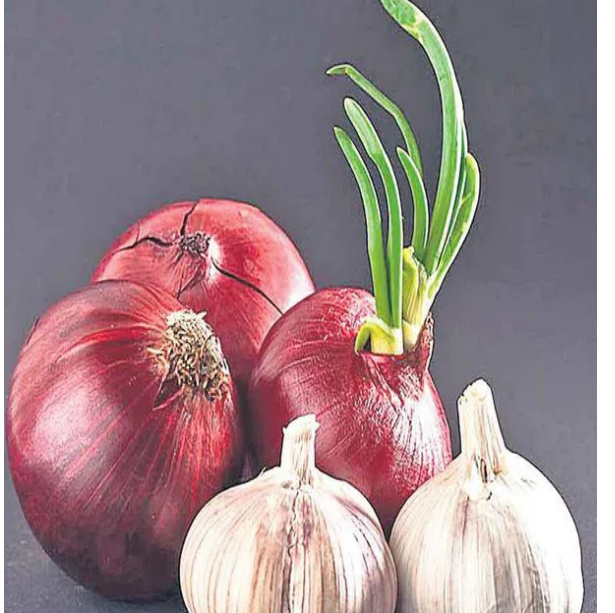
ఇవి ఆరోగ్యానికి ఎంతో మేలుచేస్తాయి.

ఏం జరుగుతుంది? ఏమైనా సైడ్ ఎఫెక్ట్స్ ఉంటాయా? దీనికి నిపుణులు చెబుతున్న సమాధానాలు ఇవిగో % రెండిట్లో పోషకాలు: ఉల్లి, వెల్లుల్లి కలిపి తినడం ఆరోగ్యానికి మంచిది. రెండిట్లోనూ యాంటి ఫంగల్, యాంటి బ్యాక్టీరియల్, యాంటి వైరల్ గుణాలు ఉంటాయి. కాబట్టి, వీటిని కలిపి తీసుకోవడం వల్ల మన రోగ నిరోధక శక్తి పెరుగుతుంది. పడేపడే జబ్బు పడకుండా ఉంటాం. మైగ్రయిన్ నుంచి ఉపశమనం: అధిక రక్తపోటు (హైపర్ టెన్షన్) ఉన్నవాళ్లు ఉల్లి, వెల్లుల్లిని కలిపి తినాలి. ఇలా చేస్తే కొంతకాలానికి ఈ సమస్య నుంచి విముక్తి లభిస్తుందంటున్నారు నిపుణులు. తొందరగా, పార్శ్వ నొప్పి (మైగ్రయిన్) తో బాధపడుతున్న వారికి కూడా ఈ రెండు మంచి ఔషధాలుగా పనిచేస్తాయి. అయితే, ఇలా కలిపి తినడానికి ముందు డాక్టర్ సలహా తీసుకుని ఆచరించడం మంచిది. కొలెస్ట్రాల్ కు బై బై: శరీరంలో కొలెస్ట్రాల్ స్థాయిలు పెరిగినప్పుడు కూడా ఉల్లి, వెల్లుల్లి కలిపి తినడం మంచిది. ఇవి కొలెస్ట్రాల్ ను అదుపులో ఉంచుతాయి. శరీరంలో కొవ్వు పేరుకుపోకుండా చేస్తాయి. ఉల్లి, వెల్లుల్లిలో విటమిన్ బి, సి, పొటాషియం పుష్కలంగా ఉంటాయి.