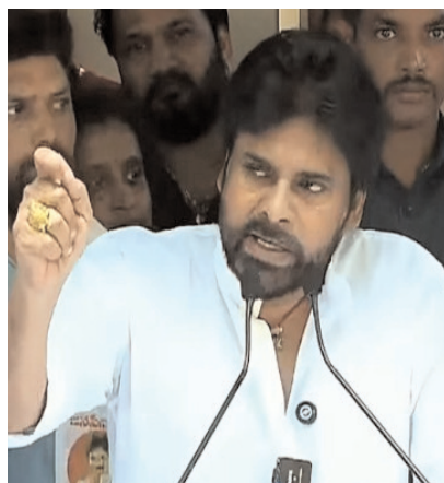
హైదరాబాద్, జూన్ 2, తెలంగాణ దిశ :