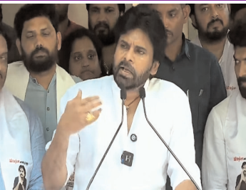
ప్రశ్నిస్తున్నారు. దాడులు చేస్తామని హెచ్చరిస్తున్నారు.

చేసిన ప్రెస్ మీట్ లో ఘాటుగా స్పందించారు. ఇక్కడ తెలంగాణలో జరిగే ఎన్నికల్లో జనసేన పార్టీ కచ్చితంగా పోటీ చేస్తుందని సంచలన ప్రకటన చేశారు. ఈ నిర్ణయంతో తెలంగాణ రాజకీయాల్లో కొత్త అధ్యాయానికి తెరలేపారు. ఈ సందర్భంగా పవన్ కల్యాణ్ మాట్లాడుతూ, "హైదరాబాద్ లో ఎలా అడుగు పెడతామని, ఇక్కడ నీకే పని అని కొందరు నన్ను