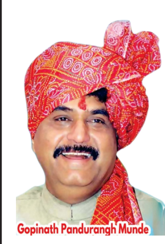
Gopinath Pandurangh Munde