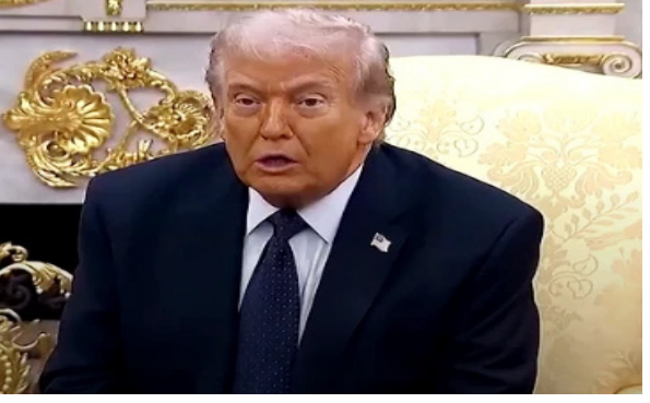
ఇరాన్పై జరిగిన తాజా దాడుల అనంతరం తగ్గిన ఆయుధ నిల్వలను పునరుద్ధరించేందుకు అమెరికా ప్రభుత్వం కీలక చర్యలకు సిద్ధమవుతోంది

ది. ఆయుధాల ఉత్పత్తిని వేగవంతం చేసే అంశంపై చర్చించడానికి ట్రంప్ పరిపాలన వైట్ హౌస్ లో అగ్రశ్రేణి రక్షణ కాంట్రాక్టర్ల ప్రతినిధులతో సమావేశం కానుందని రాయల్ ట్రి వార్తా సంస్థ వెల్లడించింది. ఈ సమావేశానికి లాకహీడ్ మార్షల్ మరియు రేథియాన్తో పాటి ప్రధాన కంపెనీల కార్పొరేషన్లు కూడా ఆహ్వానించినట్లు సమాచారం. ఉతయోధారులను వేగంగా చర్యలు తీసుకునేలా ఒత్తిడి చేయడంపై ఈ చర్చలు కేంద్రీకృతమవుతాయని ప్రాణాళికుల పరిచయమున్న వర్గాలు పేర్కొన్నాయి. అయితే, సోషల్ మీడియా వేదికలో చేసిన ఒక పోస్టులో మాజీ అధ్యక్షుడు ట్రంప్ అమెరికా వద్ద ఆయుధ సామగ్రి "వాస్తవంగా అపరిమితంగా ఉంది" అని, అవసరమైతే ఈ సామగ్రితో యుద్ధాలను "ఎప్పటికీ" విజయవంతంగా కొనసాగించగలమని వ్యాఖ్యానించారు. ఈ నేపథ్యంలో పెంటాగన్ నిల్వల పునరుద్ధరణ చర్యలు, రాజకీయ ప్రకటనల మధ్య వ్యత్యాసంపై చర్చ కొనసాగతోంది.